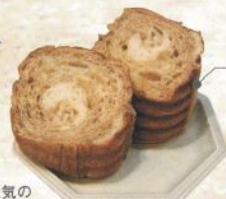
メープルラウンド (ハーフ) ¥230 (税込)

五泉市民が愛するパン屋さん。人気のメープルラウンドのほか「コーヒーパン」「バターエイト」「ヤングフランス」などレトロなネーミングが郷愁を誘います。