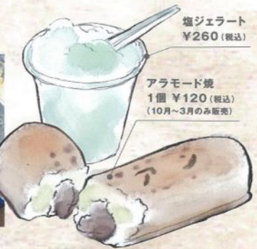
塩ジェラート ¥260 (税込)