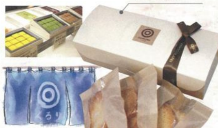
味噌ラスク 4袋入 ¥800 (税込)

洋菓子屋さんに珍しい紺染めののれんをくぐれば、そこにはヤスダヨーグルトや味噌など、地場産品を使ったスイーツが。くりりと丸い形のお菓子もかわいいですよ。