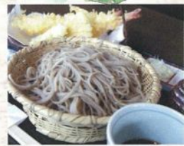
天ぶら蕎麦 ¥1,470 (税込)