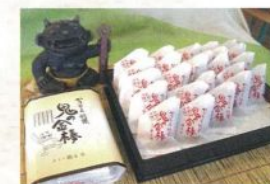
鬼の金棒 10本入 ¥950 (税込)