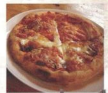
ピザ ¥890 (税込)

自慢のピザは分厚いもちっとした生地が特徴です。店の外には宮沢賢治のお話をモチーフにしたオブジェが。