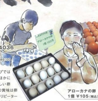
アローカナの卵 1個 ¥105 (税込)

鶏舎が隣接するショップでは新潟地鶏や烏骨鶏のほか青・桃色・双子など珍しい卵がお出迎え。ぷりぷりの黄味は卵かけごはんにおススメ。リピーター多数、地方発送もしてくれます。